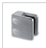
Klämfäste glas fyrkant

Kombinationen av ett klassiskt träräcke med ett modernt glas är en intressant och populär lösning för dig som redan har en altan med trästolpar. Det enda du behöver göra är att beställa klämfästen och glas. Glasräcken med klämfästen för trästolpar kan även användas om du har ett "krysstaket", då monteras glaset framför krysset.