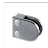
Klämfäste glas runt